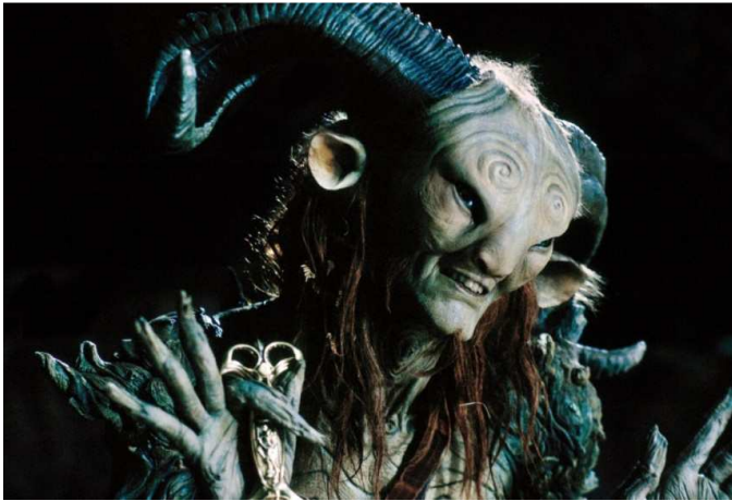
Carnita est une troll Shaman du chien. Elle travaille avec l'association TOMorrow.

Pour une fois qu'un groupe de personnes fait quelque chose de bien, on va leur donner la parole, et sur 2 pages en plus !